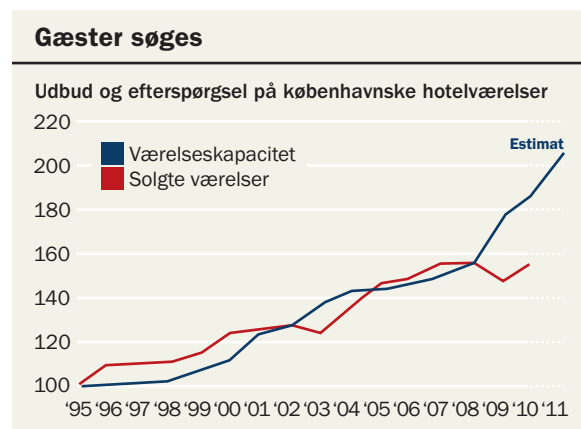
Figur 3: Det stiller store krav om flere turister, hvis det københavnske hotelmarked ikke skal bukke under. Sidste år faldt priserne med 7 %.

Han medgiver, at både Berlins og de øvrige skandinaviske hovedstæders succes med at tiltrække nye turister uden tvivl vil smitte af på København. Det helt afgørende for byens fremtid er dog, at man ikke ender som et stop på rundrejsen, men som den destination, der er udgangspunktet for rundturen. Erfaringer fra krydstogtsområdet, hvor København har opnået status som home port for den skandinaviske trafik, viser, at det udløser ekstra overnatninger og meromsætning, samtidig med at det styrker trafikken på lufthavnens interkontinentale ruter.